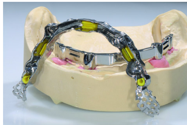
Abbildung 4 Prototyp von individualisiertem Primär- und Sekundärsteg mittels CAD/CAM-Technologie und präfabrizierten austauschbaren Friktionselementen.

Figure 3 CAD/CAM-manufactured implant bar in the lower jaw on four intraforaminal implants.