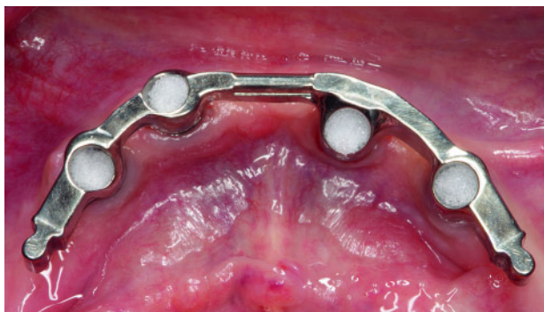
Abbildung 3 CAD/CAM-gefertigter Implantatsteg im Unterkiefer auf vier intraforaminär lokalisierten Implantaten.

Figure 3 CAD/CAM-manufactured implant bar in the lower jaw on four intraforaminal implants.