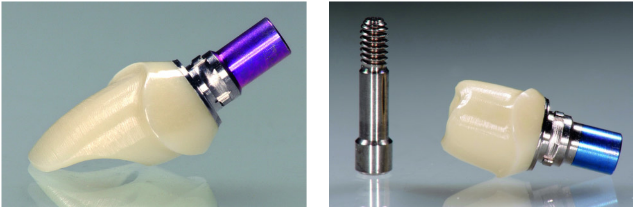
Abbildung 2a–b Individuelle CAD/CAM-Abutments aus ZrO_2 mit Klebebasis zur Aufnahme von zementierten Implantatkronen für die anteriore (a) und posteriore (b) Region.

Figure 2 a–b Individual CAD/CAM-abutments based on ZrO_2 with adhesive bonding compound for the cementation of implant crowns in the anterior (a) and in posterior (b) area.