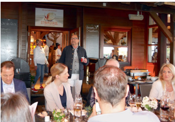
Rahmenprogramm in angesagten Locations