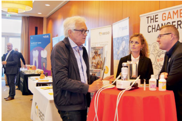
Intensive Gespräche auch in der Ausstellung...