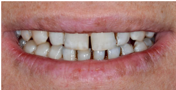
Abbildung 3: unschöne Ästhetik