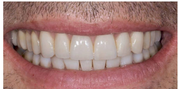
Abbildung 6: nach Komplettsanierung und teilweiser Kronenverlängerung