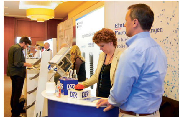
...das sorgt für zufriedene Aussteller