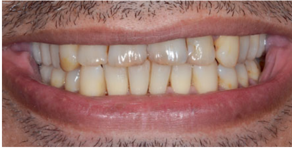
Abbildung 1: sanierungsbedürftiges Gebiss