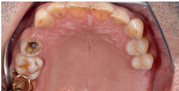
Abbildung 7: Oberkiefer vor Sanierung