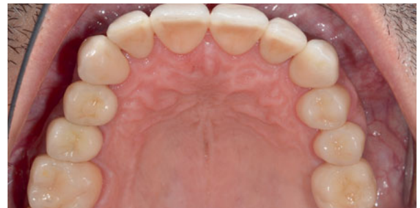
Abbildung 8: Oberkiefer nach Sanierung mit 3 Implantaten und 14 Kronen