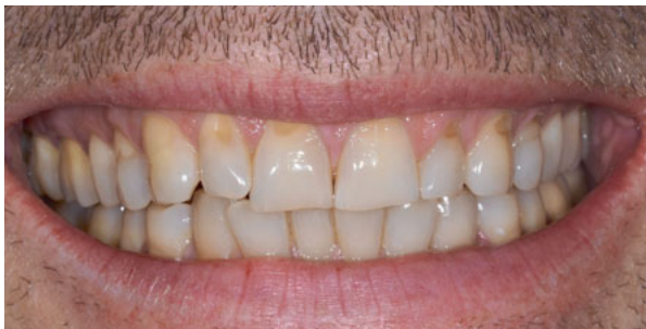
Abbildung 5: starke Erosionen und Attritionen