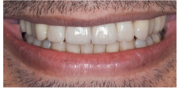
Abbildung 2: nach Gesamtsanierung