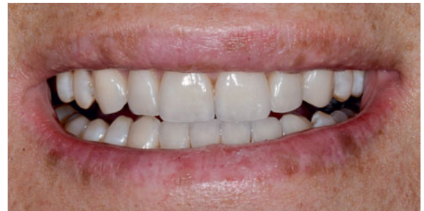
Abbildung 4: nach Behandlung mit 8 Veneers im OK und 6 Veneers im UK