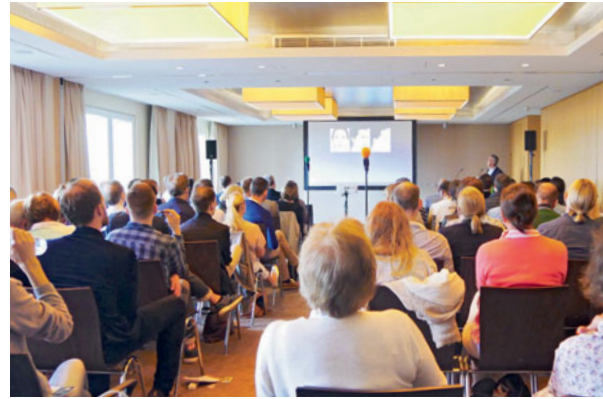
"Full House" bei den Vorträgen

gerade bei Frontzahnrestaurationen eine funktionsgerechte Rekonstruktion ist, die gleichzeitig die ästhetischen Wünsche der Patienten erfüllt.