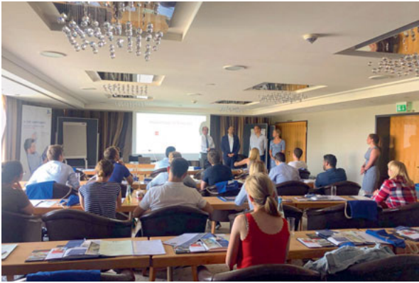
Tages-Seminar von DGI, DGÄZ und Dentista

BdZA, zum Thema „Implantologie als angestellter Zahnarzt“. Was dürfen angestellte Zahnärzte überhaupt selbst entscheiden? Darf vom Praxiskonzept abgewichen werden und wer haftet eigentlich, wenn etwas schiefgeht? Hier legte RA Wiedey den Teilnehmerinnen und Teilnehmern ans Herz, in jedem Fall auch selbst eine eigene Berufshaftpflichtversicherung abzuschließen, um eine direkte Übersicht darüber zu haben, was alles abgesichert ist. Mit einer eigenen Versicherung, die zudem nicht viel kostet, könne man ruhig schlafen.