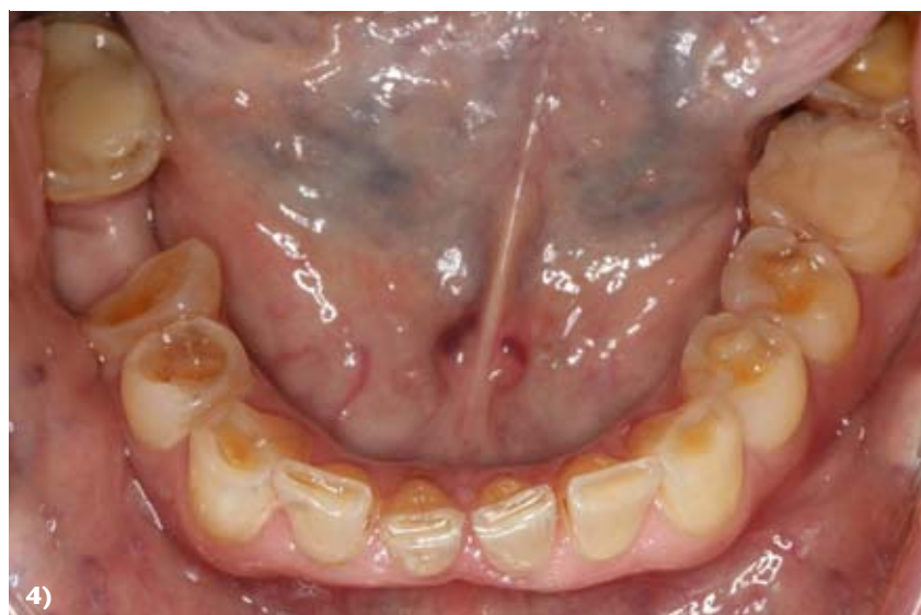
Abb. 2–4: S. Hahnel

Abbildung 2–4 Patientenfall: Der Patient wurde zu Beginn der Behandlung anhand des TWES beurteilt. Für den Oberkiefer wurde ein Wert von 4 für alle 3 Sextanten (2. Sextant palatinal 3) ermittelt, im Unterkiefer lag ein TWES von 3 (4. und 6. Sextant) sowie von 2 für den 5. Sextanten vor.