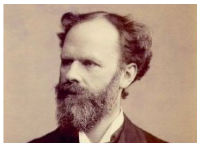
Abbildung 3 Willoughby Dayton Miller (1853–1907) – Begründer der chemisch-parasitären Karies-Theorie und berühmtester Präsident der Gesellschaft.

Doch trotz vereinter Bemühungen gelang es CVdZ und VbDZ erst im Jahr 1909, die Einführung des Abiturs als verbindliche Studienvoraussetzung für das Fach Zahnheilkunde durchzusetzen. Nun war die seit fünf Jahrzehnten angestrebte Angleichung an den bildungsbürgerlichen Beruf des Arztes erreicht. Im Jahr 1919 wurde den deutschen Zahnärzten zudem das Promotionsrecht im eigenen Fach und 1923 überdies die