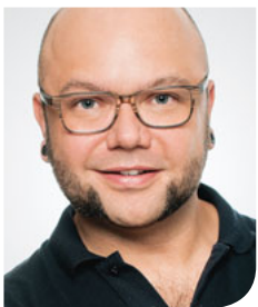
Tino Broyer, Fotograf und Inhaber der Ardent Group, Spezialist für Fotoproduktionen aus dem Bereich Gesundheit und Medizin

fünf Jahren ausgerichtet ist. Denken Sie bei der Planung Ihres Konzeptes an weitere Werbeproduktionen, wie z. B. Imagebroschüren, Plakate, Werbeanzeigen etc. Diese qualitativ hochwertigen Aufnahmen können nur mit professioneller Fotoausrüstung und entsprechendem Equipment, wie z. B. dem Einsatz von Blitzanlagen produziert werden. Je weniger die einzelnen Behandlungssituationen und Räume ausgeleuchtet sind, desto diffuser werden die Aufnahmen bei starken Vergrößerungen, wie sie z. B. für Broschüren oder Werbepлакate benötigt werden. Hierfür sind 'einfach' produzierte Fotos ohne professionelle Ausleuchtung dann unbrauchbar. Erkundigen Sie sich im Vorfeld über die Arbeitsweise des Fotografen und lassen Sie sich sogenannte 'Arbeitsproben' zeigen. Ein weiterer, wichtiger Bestandteil einer Werbeproduktion sind die sogenannten 'Fotolizenzen' und 'Modell Release Verträge'. Diese Verträge sollten kostenlos von der Agentur oder dem Fotografen bereitgestellt werden. Achten Sie also besonders bei Ihrer Fotoproduktion darauf, dass alle Seiten vertraglich abgesichert sind. Nur so haben Sie die Chance, auch über eine lange Zeitspanne mit Ihren Werbeaufnahmen effizient und erfolgreich werben zu können. Weitere Hinweise zu rechtlichen Fragen, z. B. woran Sie denken müssen, wenn Sie auch Mitarbeiter auf Ihren Werbefotos abbilden wollen, finden Sie in der Rubrik „Praxis & Recht“. Lassen Sie sich, bevor Sie anfangen, kompetent beraten.