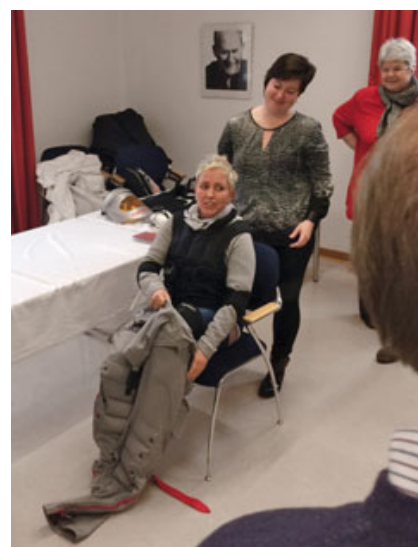
Abb. 1 Eine Kursteilnehmerin beim Anziehen des mit Gewichten beschwerten Alterssimulationsanzuges. Eine Erfahrung, die zu mehr Verständnis im Umgang mit dem älteren Menschen führen kann.

Mit theoretischen Vorträgen und praktischen Einheiten wurden in einem ersten Teil Grundlagen zur Altersmedizin, zur Multimorbidität und Multimedikation sowie zu den Auswirkungen von Alterungsprozessen auf verschiedene Organsysteme sowie zu den anstehenden gesellschaftlichen Veränderungen erläutert. Der zweite Teil thematisierte ausführlich die Auswirkungen auf die zahntechnische Arbeit unter Darstellung von prothetischen Konzepten für Senioren, unterstützt durch animierte Fallbeispiele. Die Kursteilnehmer, die aus sechs verschiedenen Bundesländern