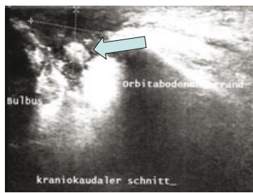
Abb. 1: Sonographische Darstellung der rechten Infraorbitalregion unserer Patientin in kraniokaudaler Ausrichtung. Der Pfeil deutet auf eine etwa 1cm große rundliche infraorbitale Raumforderung.

Es wird der Fall einer 54-jährigen Patientin geschildert, die von einer Urlaubsreise aus Peru zurückkehrte. Die Patientin präsentierte, bereits noch in Peru beginnend, eine erythematöse Papel infraorbital rechts mit zirkulärem Ödem. Nach Heimkehr stellte sich die Patientin zunächst ihrem Hausarzt vor. Da sie sich nicht an einen Biss oder Stich erinnern konnte, erfolgte eine antibiotische Therapie, die jedoch nur eine marginale Besserung herbeiführte und nach Beendigung jener zu einem weiteren Fortschreiten der initialen Symptome führte. Durch sonographische Bildgebung wurde eine raumfordernde Struktur dargestellt und eine operative Freilegung eingeleitet.