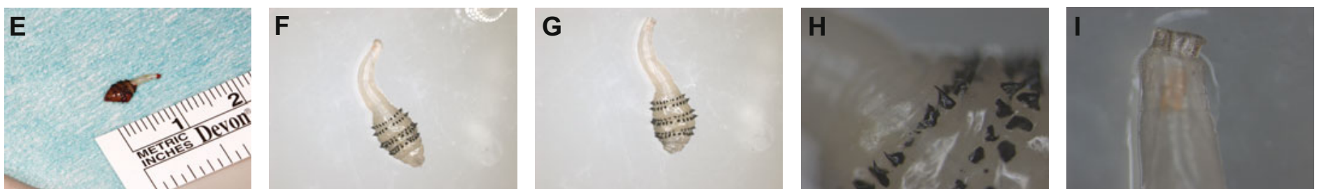
Abb. 3: Extrahierte, aufbereitete und gesäuberte Fliegenlarve der Gattung Dermatobia hominis . (E) Aus dem Operationsgebiet entfernte Fliegenlarve von ca. 1cm Länge. Die Larve lebte noch kurze Zeit nach der Entfernung aus der Infraorbitalregion. (F, G) Gesäuberte Fliegenlarve. Zu erkennen sind sechs zirkuläre Ringe aus dornenartigen Haken im Bereich des Larvenkörpers. Bei genauer Betrachtung sind diese paarweise angeordnet, sodass drei Paare erkennbar werden. (H) Vergrößerung der dornenartigen Haken. Hier ist die intensive Schwarzfärbung der Dornen besonders gut zu erkennen. (I) Darstellung des Larvenrüssels über den die Larve eine Verbindung zur Hautoberfläche behält, um die Atmung zu ermöglichen.

Nach Durchführung der operativen Wundfreilegung präsentierte sich eine ca. 1cm große Fliegenlarve im Unterhautfettgewebe. Diese wurde zur weiteren Analyse in das Institut für Tropenmedizin des Universitätsklinikums Düsseldorf übergeben. Hier wurde die Larve der Gattung Dermatobia hominis zugeschrieben.