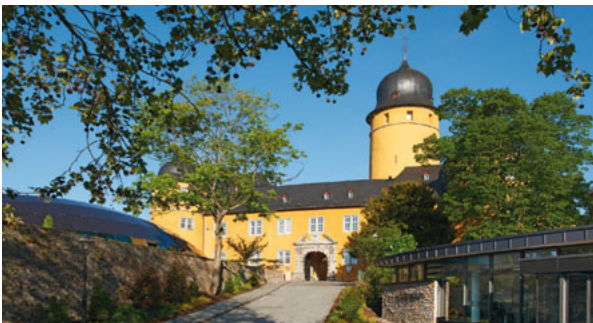
Tagungsort Schloss Montabaur

Von der Einzelzahnrestauration bis zur oralen Rehabilitation