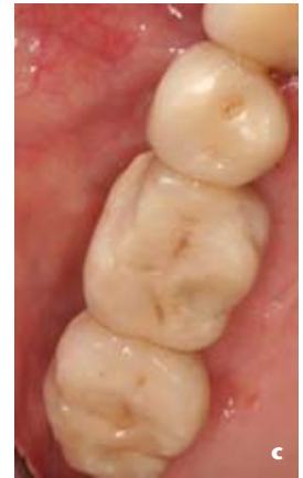
Abbildung 5c Okklusale Ansicht der Situation nach Verblendkeramikchipping an der mesiobukkalen Höckerspitze 16

den periimplantär die Rezeptoren der Gingiva, der Mukosa und des Periosts ausgeschaltet, sodass die unveränderte Tastempfindung auf eine Reaktion weiter entfernt liegender Rezeptoren hindeutet. Bei einer statischen Belastung erreichten die Ergebnisse bei anästhesierten Zähnen und Implantaten ungefähr die gleichen Werte, nämlich ca. 6 Ncm [78]. Bei einem neurophysiologischen Versuchsaufbau am Menschen, bei dem die Implantate elektrisch stimuliert wurden, konnte im Elektroenzephalogramm (EEG) eindeutig eine Antwort im Gehirn ermittelt werden, die auch nicht durch eine Oberflächenanästhesie der periimplantären Mukosa reduziert werden konnte. Die periimplantäre Mukosa scheint für das Phänomen der Osseoperzeption somit keine oder nur einen untergeordnete Rolle zu spielen [70].