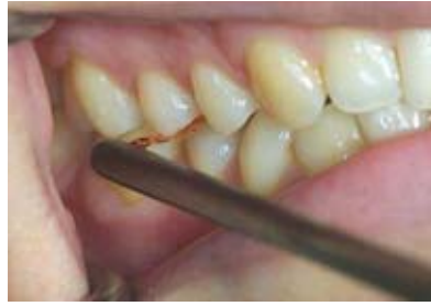
Abbildung 3b Testposition: Nach Aufforderung durch den Untersuchenden hat der Proband zusammengebissen.

Belastung des Zahns durch die Fasern des Desmodonts bestimmt bzw. begrenzt. Bei stärkerer Belastung findet in der zweiten Bewegungsphase eine elastische Deformation des Knochens statt, sobald die Kapazität des Desmodonts ausgeschöpft ist [32, 48, 60]. Die Beweglichkeit des osseointegrierten Implantats ist ausschließlich auf eine elastische Deformation des Knochens zurückzuführen und erreicht sowohl unter horizontaler als auch unter axialer Belastung nur ein Zehntel der Beweglichkeit natürlicher Zähne [52, 59]. Richter rekonstruierte jedoch ein anderes Verhalten natürlicher Zähne: Das hydraulische System des Parodontiums wird unter physiologischen Belastungen, z. B. beim Sprechen und Kauen, nur sehr kurzzeitigen Kräften ausgesetzt; eine Verdrängung der Gewebsflüssigkeit aus dem Desmodontalspalt kann nicht erfolgen, weil dafür länger einwirkende Kräfte notwendig wären. Bei normaler Funktion verhalten sich natürliche Zähne in ihrem Bewegungsmuster also sehr ähnlich wie Implantate. Die große Intrusionskapazität der Zähne wird erst bei Parafunktionen ausgeschöpft [54].