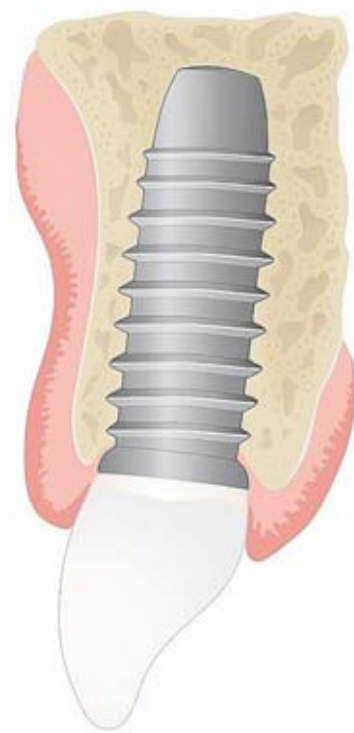
Abbildung 2 Schematische Darstellung eines Querschnitts durch ein osseointegriertes Implantat mit periimplantärem Hart- und Weichgewebe

Bei geringerer interokklusaler Distanz, also bei geringeren Dicken der interponierten Fremdkörper, wird die Tastempfindlichkeit feiner und von den Exterozeptoren bestimmt [26, 71]. Diese Mechanorezeptoren liegen in der Gingiva, der alveolaren Mukosa und vor allem im parodontalen Ligament, das offensichtlich bereits auf geringe auf die Zähne ausgeübte Kräfte reagiert. Van Steenberghe stellte fest, dass die funktionellen Eigenschaften der Parodontalrezeptoren mit denen der Rezeptoren der übrigen Körperhaut vergleichbar seien [71]. Die Vermutung, dass Nervenendigungen der Zahnpulpa nicht nur im Rahmen der Nozizeption, sondern auch als Rezeptoren in die Tastsensibilität involviert sein könnten [35], ließ sich in der Folge nicht