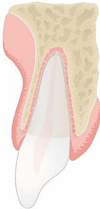
Abbildung 1 Schematische Darstellung eines Querschnitts durch einen natürlichen Zahn mit parodontalem Gewebe

Beim interokklusalen Tastempfinden natürlicher Zähne spielen – abhängig von der Mundöffnung – so-