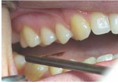
Abbildung 3a Versuchsablauf zum interokklusalen Tastvermögen/aktiven Tastempfinden: Mundwinkel mit Fotohaken abgehalten und Testfolie interokklusal eingebracht