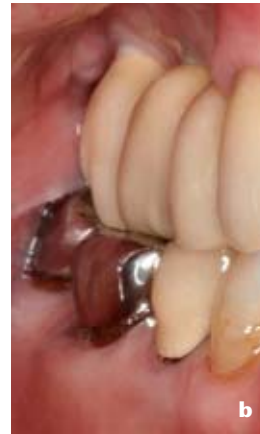
Abbildung 5b Bukkale Ansicht der Situation nach Verblendkeramikchipping an der mesiobukkalen Höckerspitze 16