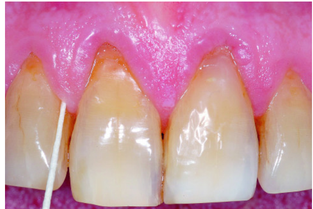
Abbildung 3 Subgingivale Probenentnahme mit steriler Papierspitze. Figure 3 Subgingival sampling with a sterile paperpoint.

Figure 2 Limited access for periodontal instrumentation in multi-rooted teeth with furcation defects because of a complex morphology.