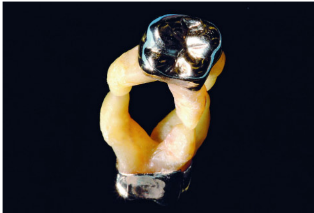
Abbildung 2 Aufgrund der komplexen Morphologie mehrwurzeliger Zähne ist der Zugang im Rahmen des subgingivalen Debridements bei Furkationsbeteiligung limitiert.

Figure 2 Limited access for periodontal instrumentation in multi-rooted teeth with furcation defects because of a complex morphology.