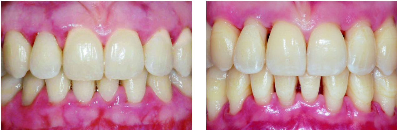
Abbildung 1a–b Klinischer Fotostatus einer 25-jährigen Patientin mit generalisierter aggressiver Parodontitis vor und 6 Wochen nach dem mechanischen Debridement und adjuvanter systemischer Antibiose im Rahmen der nichtchirurgischen Parodontaltherapie mit deutlich sichtbarer Reduktion der klinischen Entzündungszeichen und Ausbildung parodontaler Rezessionen.

Figure 1a–b Clinical situation of a 25-year old patient with generalized aggressive periodontitis before and six weeks after mechanical debridement and adjuvant systemic antibiotics in the course of non-surgical periodontal therapy with significant reduction of inflammatory signs and development of periodontal recessions.