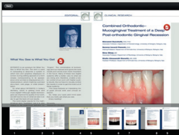
Abb. 1 Ein Screenshot der neuen iPad-App. Sie können einfach zu dem Artikel scrollen, den Sie lesen möchten. Weiterhin können Sie den Titel, die Autoren und das Abstract an andere Interessierte weiterleiten.