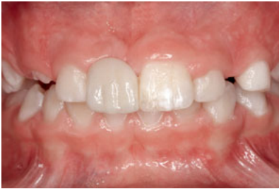
Abb. 9 Eingegliederte Adhäsivbrücke direkt nach der Eingliederung. Die Patientin und ihre Eltern wünschten ausdrücklich keine Reproduzierung der weißlichen Flecken des Pfeilerzahns 21 in der Verblendung von 11.