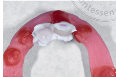
Abb. 8 Die Fließsilikonprobe zeigt, dass das Brückenglied dem Weichgewebe dicht aufliegt.