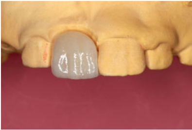
Abb. 6 Ansicht der labial verblendeten Adhäsivbrücke auf dem Modell.