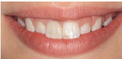
Abb. 12 Lippenbild der nun 11-jährigen Patientin 2 Jahre später.