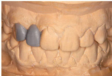
Abb. 24 Wax-up von Adhäsivbrücke und Zahnverbreiterung von 13, um eine adäquate Breite des Brückenglieds 12 zu erzielen.