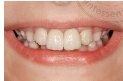
Abb. 29 Lippenbild der Patientin nach Versorgung mit 2 einflügeligen Adhäsivbrücken zum Ersatz beider zentralen Schneidezähne.

Abb. 30 Labialansicht der beiden Adhäsivbrücken mit retrahierten Lippen.