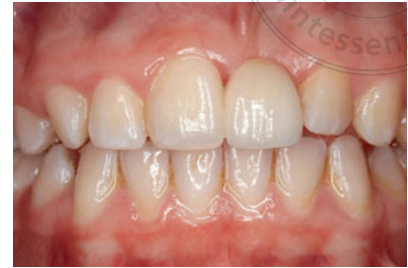
Abb. 19 Ansicht von labial wenige Tage nach Eingliederung der Adhäsivbrücke.

Adhäsivbrücke an die bei Kindern und jungen Jugendlichen häufiger im Rahmen des Älterwerdens auftretenden Veränderungen der natürlichen Zähne anpassen zu können 27 , z. B. eine dunklere Farbe der natürlichen Zähne durch Sekundärdentinbildung und eine Verlängerung der klinischen Krone.