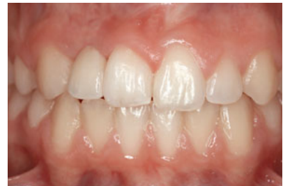
Abb. 25 Ansicht nach Eingliederung der Adhäsivbrücke zum Ersatz von Zahn 12 und mesialer Verbreiterung des Eckzahns 13.