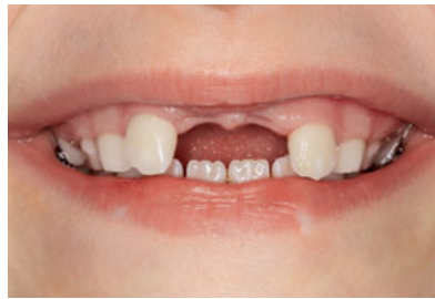
Abb. 28 Lippenbild einer Patientin im Alter von 8 Jahren und 6 Monaten mit Verlust beider zentralen Schneidezähne.