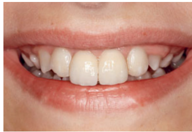
Abb. 33 Lippenbild der nun 11-jährigen Patientin 2 Jahre und 6 Monate später.

Abb. 32 Nachts trägt die Patientin eine 0,5 mm starke Tiefziehschiene von 12–22, um eine Wanderung der beiden Pfeilerzähne mit ihren Brücken zu verhindern.