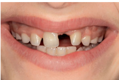
Abb. 14 Lippenbild einer Patientin im Alter von 11 Jahren und 6 Monaten mit Verlust des linken mittleren oberen Schneidezahns ein Jahr zuvor ohne weitere Versorgung.