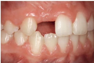
Abb. 23 Lateralansicht der 13-jährigen Patientin aus den Abb. 2 und 3. Es ist klar erkennbar, dass die Lücke für einen lateralen Schneidezahn zu groß ist. Eine kieferorthopädische Optimierung der Lücke war nicht möglich.