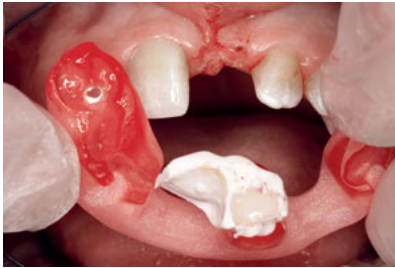
Abb. 17 Passungskontrolle der Adhäsivbrücke mithilfe von Positionierungsschlüssel und Fließsilikon. Das Brückenglied liegt dem Weichgewebe dicht auf.