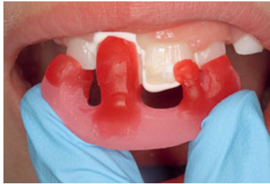
Abb. 7 Anprobe von Positionierungsschlüssel und Fließsilikonprobe zur Passungskontrolle.