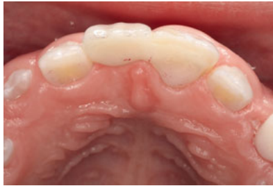
Abb. 10 Ansicht von okklusal mit Darstellung der okklusalen Kontaktpunkte.