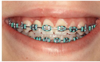
Abb. 2 Lippenbild einer 13-jährigen Patientin mit Nichtanlage von Zahn 12 nach kieferorthopädischer Vorbehandlung vor Abnahme der Multibandapparatur.