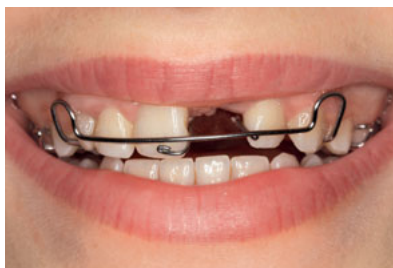
Abb. 15 Lippenbild der nun 13-jährigen Patientin nach Aufrichtung des gekippten Zahns 11.