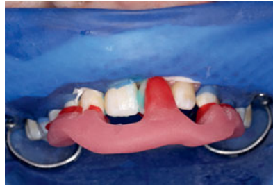
Abb. 18 Eingliederung der Adhäsivbrücke unter Kofferdam. Der verwendete phosphatmonomerhaltige Kompositkleber Panavia 21 TC (Fa. Kuraray, Hattersheim) verbindet korundgestrahlte Zirkonoxidkeramik und säuregeätzten Zahnschmelz äußerst dauerhaft.