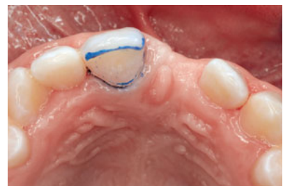
Abb. 16 Minimalinvasive, nur auf den Zahnschmelz begrenzte Präparation für einen vollkeramischen Adhäsivflügel.