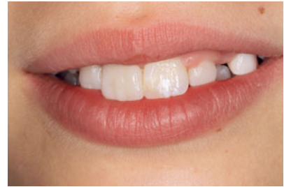
Abb. 11 Lippenbild der 9-jährigen Patientin bei Eingliederung der Adhäsivbrücke.