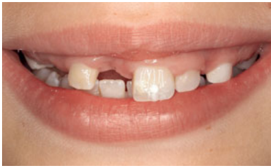
Abb. 1 Lippenbild einer 9-jährigen Patientin mit traumatischem Verlust des rechten mittleren oberen Schneidezahns.