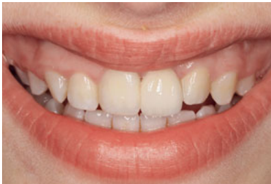
Abb. 20 Lippenbild der 13-jährigen Patientin.