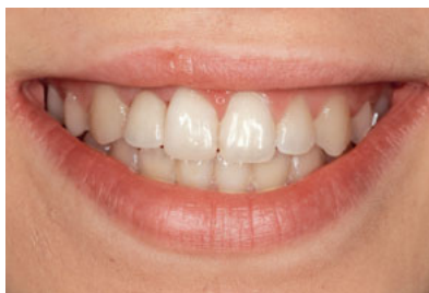
Abb. 27 Lippenbild der nun 15-jährigen Patientin 2 Jahre später. Die zu kurze mesiale Inzisalkante von Zahn 11 wurde inzwischen noninvasiv mit Kompositkunststoff aufgebaut.

ästhetisch gute Ergebnisse zu erzielen. Bei zu breiten Zahnlücken sollte eine kieferorthopädische Einstellung der Lückenbreite gegenüber einer Verbreiterung der Nachbarzähne abgewogen werden (Abb. 23 bis 27), während bei zu schmalen Zahnlücken eine kieferorthopädische Lückenöffnung gegenüber einer leichten Überstellung des Brückenglieds vor den Pfeilerzahn diskutiert werden sollte.