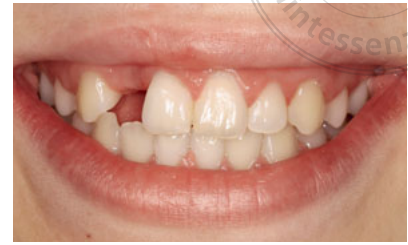
Abb. 3 Lippenbild der 13-jährigen Patientin nach Abnahme der Multibandapparatur.

Die oberen lateralen Schneidezähne gehören neben den unteren zweiten Prämolaren zu den am häufigsten nicht angelegten Zähnen, wobei Mädchen signifikant häufiger von Nichtanlagen betroffen sind als Jungen. Durchschnittlich sind bei knapp 2 % der Menschen die oberen lateralen Schneidezähne nicht angelegt 26 . Das bedeutet, dass allein in Deutschland zehntausende Jugendliche davon betroffen sind. Häufig werden diese Patienten kieferorthopädisch behandelt und wünschen nach Abschluss der kieferorthopädischen Therapie zeitnah festsitzenden Zahnersatz (Abb. 2 und 3).