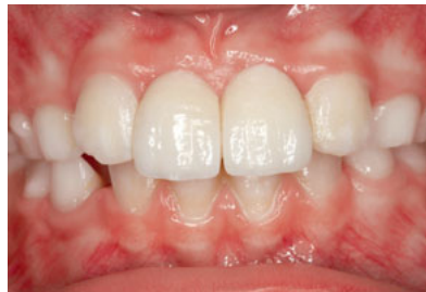
Abb. 30 Labialansicht der beiden Adhäsivbrücken mit retrahierten Lippen.

Abb. 29 Lippenbild der Patientin nach Versorgung mit 2 einflügeligen Adhäsivbrücken zum Ersatz beider zentralen Schneidezähne.