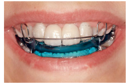
Abb. 34 Lippenbild mit eingesetzter funktionskieferorthopädischer Apparatur und Retentionsschiene. Aufgrund der unverblockten, einflügeligen Gestaltung der beiden Adhäsivbrücken ist eine abnehmbare und später auch festsitzende kieferorthopädische Therapie unproblematisch möglich.

Abb. 33 Lippenbild der nun 11-jährigen Patientin 2 Jahre und 6 Monate später.