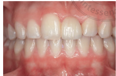
Abb. 22 Ansicht von labial mit retrahierten Lippen nach nahezu 5 Jahren Tragezeit. Es ist kein weiterer Gewebeverlust im Bereich des Brückenglieds aufgetreten. Das nun etwas zu kurze Brückenglied könnte durch Ersatz der Verblendung an den Pfeilerzahn angepasst werden 27 .