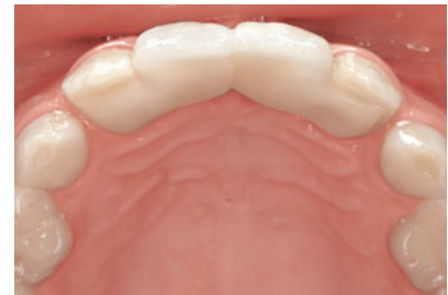
Abb. 31 Ansicht von okklusal. Die beiden Brückenglieder sind über einen seichten approximalen Interlock verbunden, d. h. das Brückenglied an Zahn 21 weist eine seichte vertikale Rille und das Brückenglied an Zahn 11 eine entsprechende vertikale Leiste auf. Dadurch stabilisieren sich die Brücken bei Belastung gegenseitig, ohne eine starre Verblockung auszuweisen.