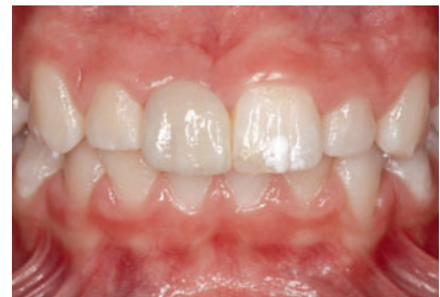
Abb. 13 Ansicht von labial mit retrahierten Lippen. Da die natürlichen Zähne mit zunehmendem Alter dunkler werden, wird der Unterschied in der Zahnfarbe in den nächsten Jahren abnehmen. Die Patientin und ihre Eltern sind zusätzlich darüber informiert worden, dass die labiale Verblendung in höherem Lebensalter ggf. ausgetauscht werden sollte, um Zahnfarbe und Form anzupassen 27 .