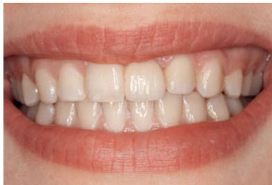
Abb. 21 Lippenbild der nun 18-jährigen Patientin nahezu 5 Jahre später.