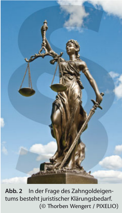
Abb. 2 In der Frage des Zahngoldeigentums besteht juristischer Klärungsbedarf.

lich) übergab und übereignete, womit das Eigentum an dem Zahngold an den Patienten übergang ... aber nur für eine juristische Sekunde! Mit der festen Einfügung des Zahngolds in das Gebiss des Patienten verliert dies seine Sachqualität und wird Teil des menschlichen Körpers. Anders wäre dies, wenn Gold im Rahmen einer herausnehmbaren Prothetik verwendet worden wäre; dieses bliebe mangels fester Verbindung mit dem Körper eine Sache und gehört dem Patienten. Wenn der Patient stirbt, gehört der nicht festsitzende Zahnersatz automatisch dem Erben, der in die Eigentümerstellung einrückt.