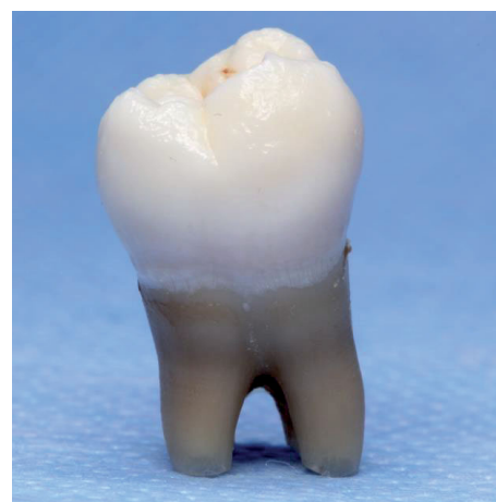
Abb. 2.1: Buccalansicht Zahn 48