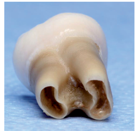
Abb. 2.4: Apikalansicht Zahn 48