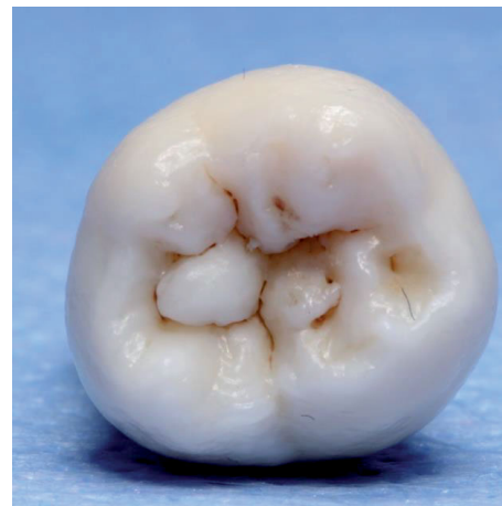
Abb. 2.3: Okklusalansicht Zahn 48