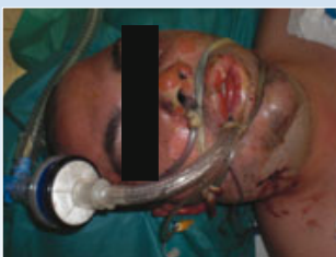
Die Verlegung des Patienten erfolgte intubiert und beatmet luftgebunden vom Unfallort

Der hier vorgestellte Patient hatte durch die Explosion Verbrennungen im Bereich des Gesichts und beider Hände erlitten. Ebenfalls hatte ein ca. 3 x 1 x 1 cm großer Metallkörper den Unterkiefer rechtsseitig durchschlagen und war bis in die Halsweichteile in den Bereich des Larynx vorgedrungen. Der nach der CT-Diagnostik sofort eingeleitete operative Eingriff erfolgte gemeinsam mit den Kollegen plastischen Chirurgie. Der Fremdkörper konnte somit in gleicher Sitzung mit der Versorgung der Brandverletzung durchgeführt werden. Zur Sicherstellung der Atemwege wurde der Patient tracheotomiert. Die Überwachung konnte auf der Brandverletztenintensivstation sichergestellt werden. Das Metallschrapnell stellte sich als ein Stück der metallenen Wand eines der explodierten Gastanks heraus. Knochentrümmer und das Schrapnell wurden in toto über die bereits bestehende Weichteilverletzung geborgen. Der Patient konnte sich nach mehreren Wochen Rekonvaleszenz vollständig erholen.