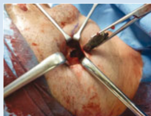
Der Unterkiefer zeigte einen deutlich umschriebenen knöchernen Defekt ohne Unterbrechung der Unterkieferkontinuität