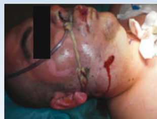
Die Verletzung im Bereich des Unterkiefers erscheint klinisch zunächst wie eine oberflächliche Weichteilverletzung