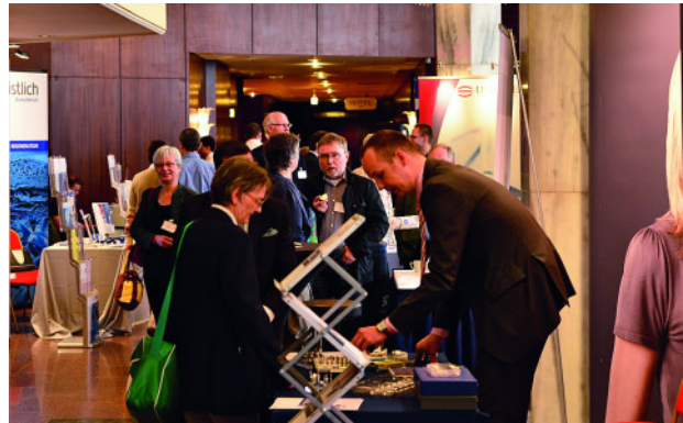
Abbildung 4 Die Industrieausstellung lädt traditionell zum Verweilen ein.

gung durch Nähte und Kompressionen. Die Datenlage als Entscheidungsgrundlage für oder gegen eine Änderung der Antikoagulation ist noch immer wenig aussagekräftig. Wichtig für diese Entscheidung ist der Umfang des Eingriffes, aber auch das Vorhandensein eventueller weiterer Einflussfaktoren auf die Blutgerinnung. In der Diskussion wurde zu Recht eingeräumt, dass bisherige Studien zahlenmäßig, auch methodisch und hinsichtlich der Berücksichtigung von Begleiterkrankungen für eine sichere Einordnung im Sinne von Leitlinien noch unzureichend sind. Generell führt ein Bridging mit Heparin nicht zu weniger Blutungsereignissen, diese sind aber bei eingetretener Blutung besser steuerbar. Problematisch bleiben Doppelverordnungen der Thrombozythenaggregationshemmer ASS und Clopidogrel.