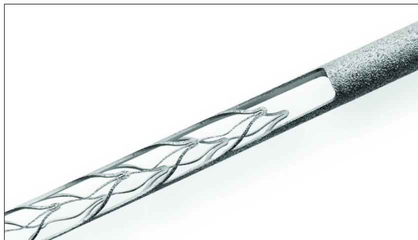
Abbildung 6 Self adjusting file, Detailansicht der Feile.

(Abb. 5 u. 6: Re-Dent-Nova, Ra'anana, Israel)