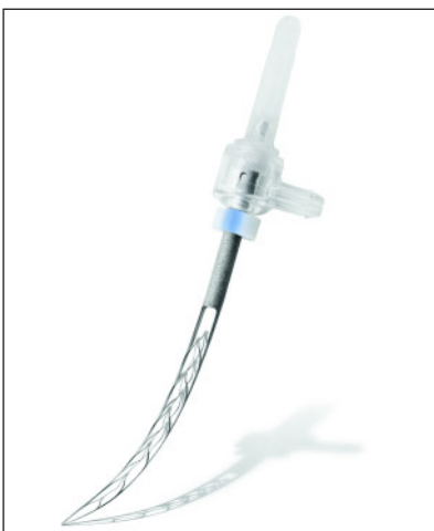
Abbildung 5 Self adjusting file, gebogene Form der Feile.