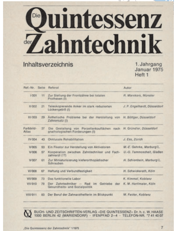
Abb. 1 und 2 Impressum und Inhaltsverzeichnis der ersten Ausgabe der Quintessenz Zahntechnik.

Digitalisierung in der Fertigung und zu einer Änderung des Berufsbilds. Wer in dieser Dynamik unserer Branche mit immer kürzeren Innovationszyklen nicht aktuell mitreden konnte und kann, hat wenige berufliche Überlebenschancen.