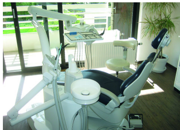
Abbildung 4 Blick in einen weiteren Behandlungsraum.