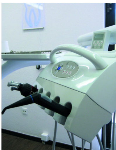
Abbildung 6 Das tägliche Behandlungswerkzeug von Herrn Herpens.