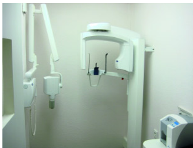
Abbildung 5 Der Röntgenraum.