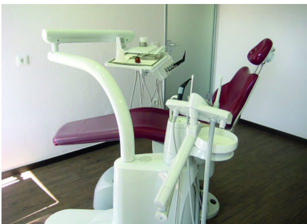
Abbildung 3 Blick in einen Behandlungsraum.

Herpens: Am Beruf des Zahnarztes gefällt mir im besonderen Maße, dass es sich um eine abwechslungsreiche Tätig-