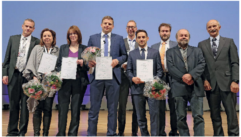
Abbildung 2 Die Preisträger des 1. und 2. Preises des Dental Education Award der Kurt-Kaltenbach-Stiftung.