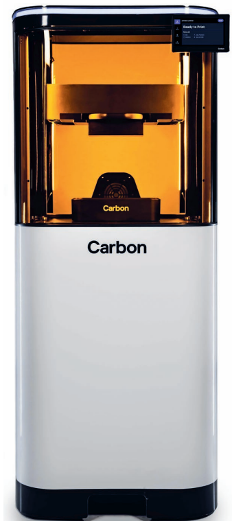
Abb. 1 Carbon bietet mit den neuen DLS-3-D-Druckern der M-Serie (hier im Bild der M3) Geräte, mit denen im Vergleich zu früheren Generationen ein bis zu 2,5-fach höherer Durchsatz an Dentalmodellen möglich ist.

wertige dentale Applikationen herstellen. Unsere neue M-Serie bietet beispielsweise eine bis zu 2,5-fache Verbesserung des Durchsatzes bei Dentalmodellen im Vergleich zu früheren Generationen und steigert damit den Mehrwert für Dentallabore (Abb. 1). Mit ihrer Genauigkeit und Zuverlässigkeit sind die Drucker der Carbon M-Serie ideal für Dentallabore, die Modelle, Schienen und weitere Komponenten herstellen möchten (Abb. 2 bis 5). Die L1 Production Solution ist ebenfalls eine transformative Produktionsplattform für die Herstellung von Aligner-Modellen. Dentallabore, die Modelle für das Thermoformen von Alignern in hoher Stückzahl herstellen müssen,