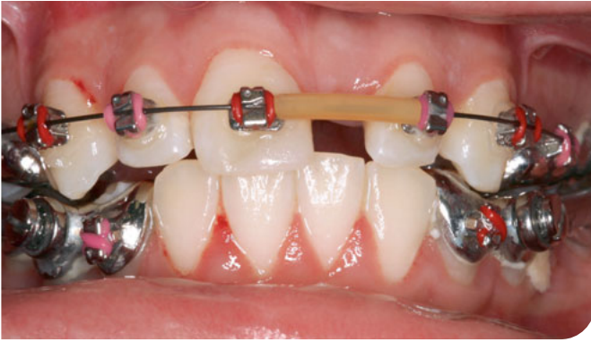
Abb. 3 Jugendliche Patientin mit festsitzender kieferorthopädischer Apparatur nach traumabedingtem Zahnverlust von Zahn 21 mit Gingivitis aufgrund von unregelmäßiger Durchführung häuslicher Mundhygienemaßnahmen.