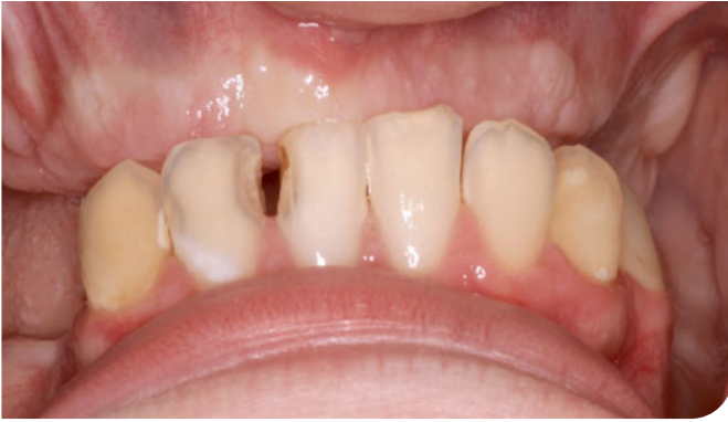
Abb. 1 Zustand nach umfassender chirurgischer Zahnsanierung bei einem Jugendlichen ohne Allgemeinerkrankungen mit hoher Kariesaktivität und kariös bedingter Zerstörung nahezu aller bleibender Zähne ausgenommen der Zähne 34 bis 43. Die weiß-opaken Läsionen an den Zähnen 32 bis 43 lassen auf eine noch immer erhöhte Kariesaktivität schließen. Nach Mundhygieneinstruktion und Remotivation erfolgte die Sanierung der kariösen Läsionen mit adhäsiven Kompositrestaurationen und eine Überweisung des Patienten zur prothetischen Versorgung.