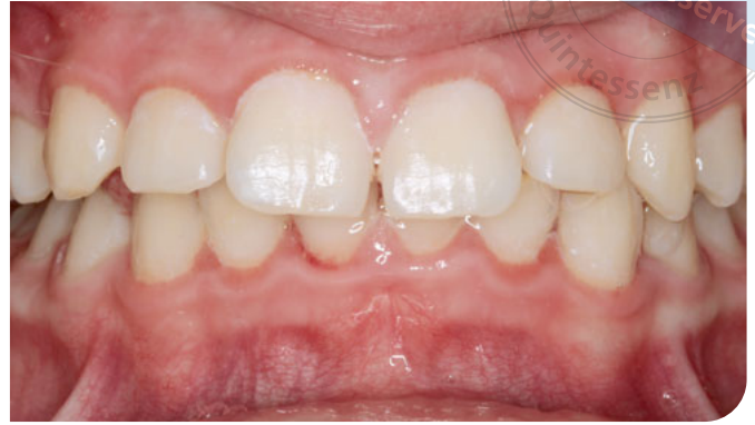
Abb. 2 Pubertätsassoziierte Gingivitis bei einer jugendlichen Patientin mit deutlichen Entzündungszeichen der Gingiva (Schwellung, Rötung, Blutung auf Sondieren) infolge unzureichender mechanischer Entfernung des Biofilms im Gingivarandbereich.

seine Neubildung zu vermeiden, was der Prävention von Karies 9 und parodontalen Erkrankungen dient 10 . Zur mechanischen Entfernung des Biofilms wird das (mindestens) zweimal tägliche Zähneputzen empfohlen 9-11 , das zur Kariesprävention mit einer fluoridhaltigen Zahnpasta (1.450 ppm Fluoridgehalt, Menge 0,5–1 g) erfolgen sollte 11 . Nach Metaanalysen der Cochrane Collaboration eignen sich elektrische Zahnbürsten im Vergleich zu Handzahnbürsten kurz- und langfristig besser zur Reduktion des Biofilms (um 11–21 %) und der Gingivitis (um 6–11 % nach dem Gingival-Index nach Löe und Silness) bei einer moderaten Qualität der Evidenz 12 . Die zusätzliche Verwendung von Interdentalbürstchen oder Zahnseide, wobei erstere bei Indikation bevorzugt zum Einsatz bei der Prävention und der Therapie der Gingivitis kommen sollen 10 , kann eine Reduktion des Biofilms an den Approximalflächen, die der Reinigung mit der Zahnbürste unzugänglich sind, ermöglichen 9,13 und Gingivitis reduzieren 13 . Zur Prävention und zum Management der gerade während der Pubertät