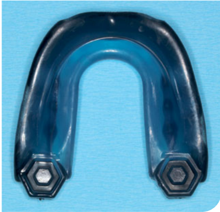
Abb. 5 Boil-and-Bite-Version eines Sportmundschutzes (Gel Max, Fa. Shock Doctor, United Sports Brand, Olen, Belgien) vor der Individualisierung. Nach dem Erwärmen des thermoplastischen Materials kann der Sportmundschutz durch Zubeißen individuell angepasst werden. Die Zahnimpressionen dienen der Retention nach dem Erhärten des Materials.