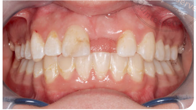
Abb. 4 Nach Abschluss der kieferorthopädischen Behandlung zeigten sich weitere Folgen der mangelnden Mundhygiene bei derselben Patientin in Form von initialkariösen Läsionen angrenzend an die Bracket-Klebestellen.

ken, der beginnende Kaffeekonsum und Junkfood stehen regelmäßig auf dem Ernährungsplan 2,7 . Eine sorgfältige Ernährungsanamnese und -beratung können dabei helfen, die Menge sowie die Häufigkeit des Konsums kariogener und erosiver Nahrungsmittel und Getränke zu reduzieren 2,9 .