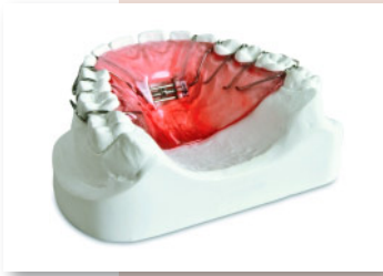
Die Diastemaplatte: ein Beispiel für Permadental KFO-Apparaturen.

Seit Frühjahr 2010 plant und produziert Permadental auch für kieferorthopäden und kieferorthopädisch tätige Zahnarztpraxen KFO-Apparaturen. Und dies zu Konditionen von 30 % unter BEL-II-Preisen. Hierfür wurden KFO-Spezialisten in 's-Heerenberg/Niederlande eingestellt, welche u. a. die Planung vornehmen. Der Workflow umfasst alle Arbeiten: Ausgießen des Modellpaares, über den dreidimensionalen Modellbefund, Ermittlung des Behandlungsbedarfsgrades (KIG), Fern-Röntgenauswertung, Erstellung eines Behandlungsvorschlags und Planung und Fertigung der kieferorthopädischen Geräte. Mit dieser Offerte will Permadental dem Behandler mehr Freiräume für andere Arbeiten in der Praxis schaffen und einem größeren Kreis von Patienten eine kieferorthopädische Behandlung ermöglichen. Permadental bietet zur Einführung und zum Kennenlernen Angebote, die die Leistungsfähigkeit des Herstellers von Zahnersatz auch im KFO-Bereich unter Beweis stellen, so Zahntechnikermeister Frank-Robert Rolf .