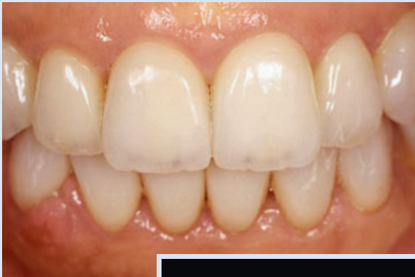
> Abb. 3-5e