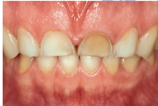
> Abb. 3-7b