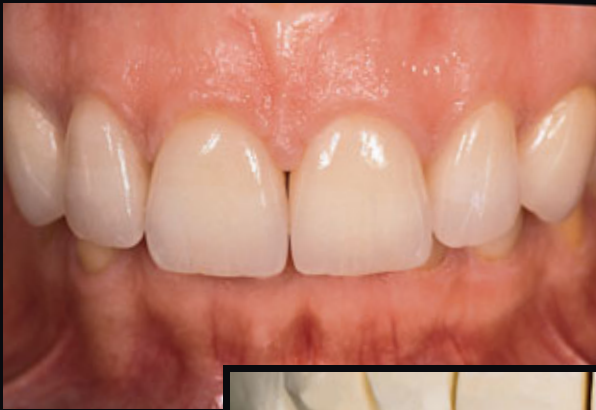
> Abb. 3-7d