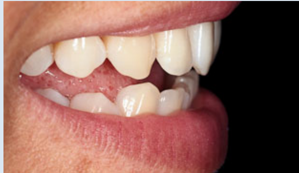
> Abb. 3-4b