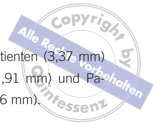
Abb. 6 In jungen Jahren sind vom inzisalen Kronendrittel der oberen Schneidezähne bei ruhendem Unterkiefer rund 2–4 mm zu sehen (a, b, d und e). Mit dem Alter rücken dann oft zunehmend die unteren Schneidezähne ins Blickfeld. Schuld daran ist der abnehmende Muskeltonus der perioralen Weichteile (c, f und g).