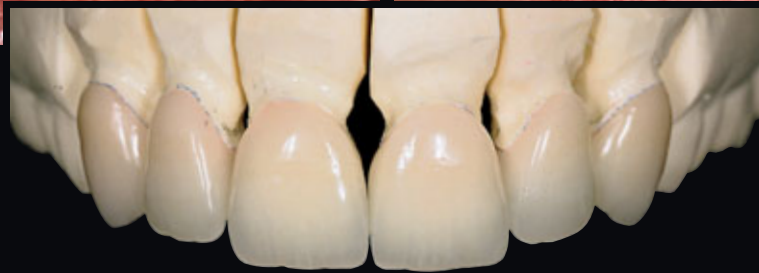
> Abb. 3-7f