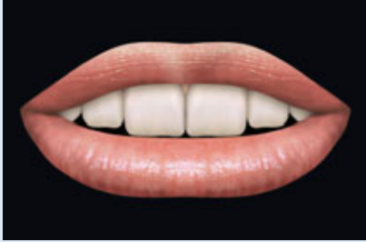
> Abb 3-6a