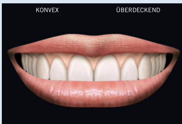
> Abb. 3-10a