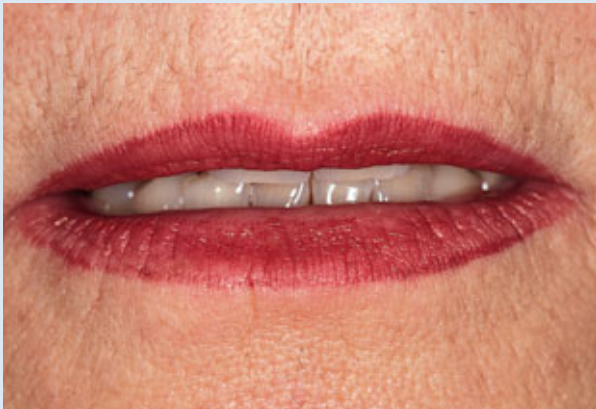
> Abb. 3-6f