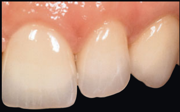
> Abb. 3-7h