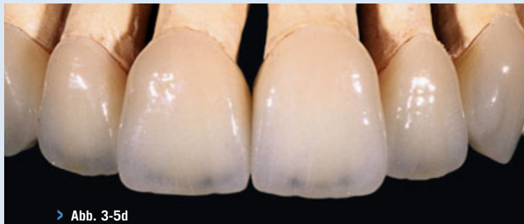
> Abb. 3-5d