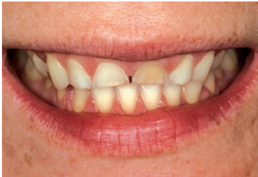
> Abb. 3-7a