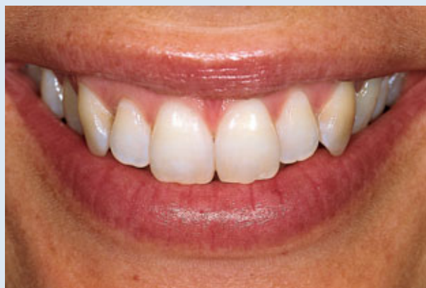
> Abb. 3-9b