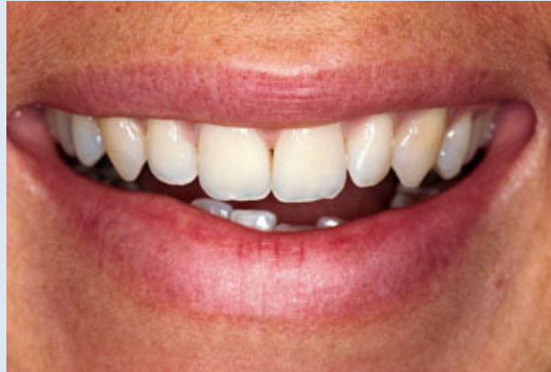
> Abb. 3-3b