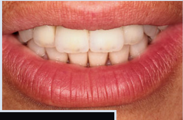
> Abb. 3-5f