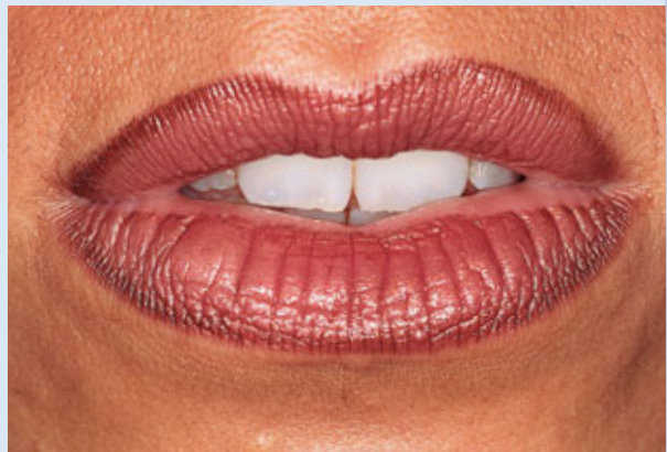
> Abb. 3-6e