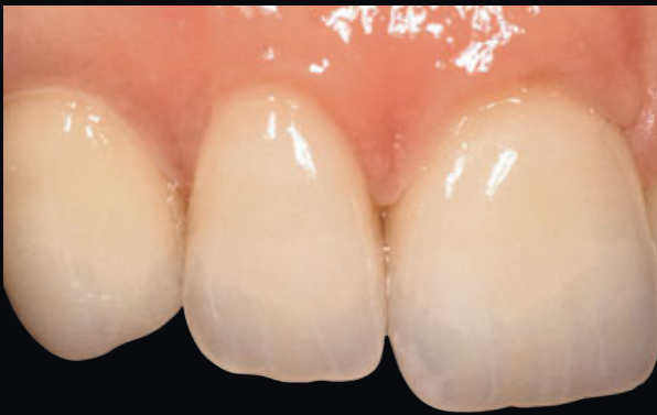
> Abb. 3-7g