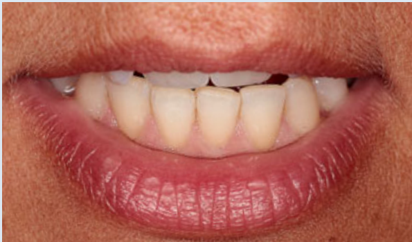
> Abb. 3-4c