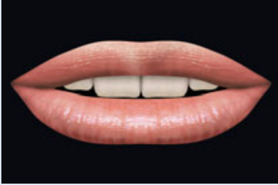
> Abb 3-6b