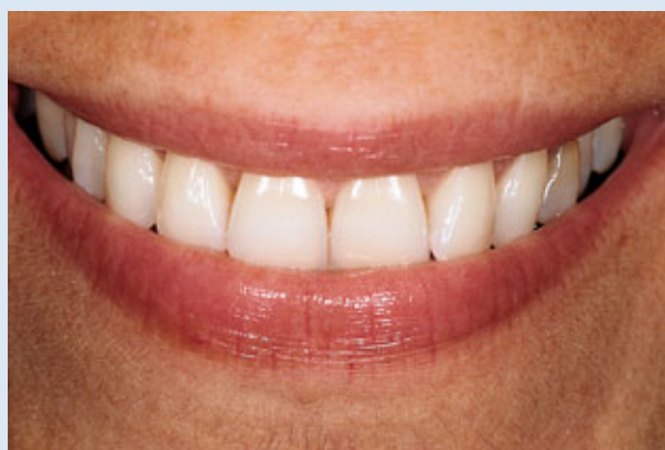
> Abb. 3-10b

Abb. 8 Der Schneidekantenverlauf ist unter normalen Umständen parallel zur Unterlippe gewölbt, was dem Erscheinungsbild eine radiale Symmetrie verleiht. Je nach Distanz zwischen Schneidekanten und Unterlippe können wir zwischen einem berührungsfreien (3-8 a und b), einem berührungsaktiven (3-9 a und b) und einem überdeckenden Verhältnis (3-10 a und b) unterscheiden.