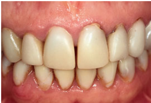
> Abb. 3-5a

entfalten, und die periorale Muskulatur kann zu einem natürlichen Bewegungsablauf zurückfinden (Abb. 3-5 d bis h). Gibson 12 hat einige Übungen entwickelt, die diesen Prozess fördern. Diese haben allerdings keinen nachhaltigen Effekt, sondern bleiben nur wirksam, solange der Patient sie tatsächlich ausführt. 13,14