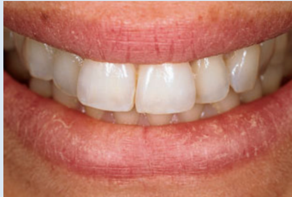
> Abb. 3-8b