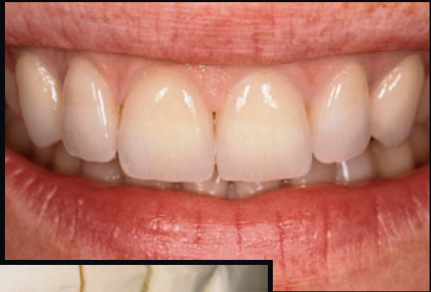
> Abb. 3-7e