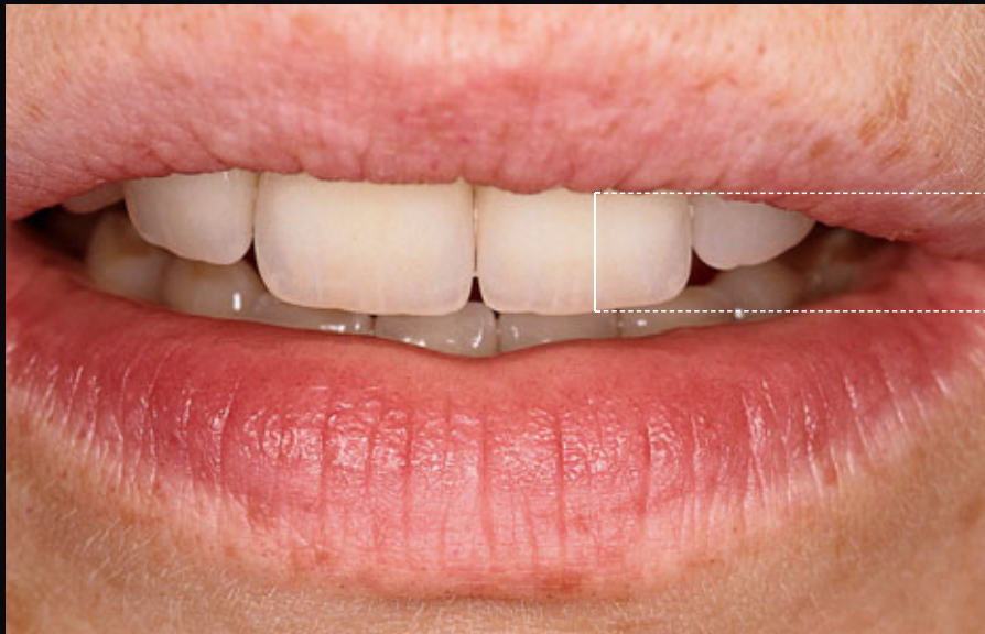
> Abb. 3-7i