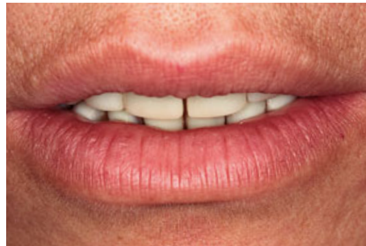
> Abb. 3-5b