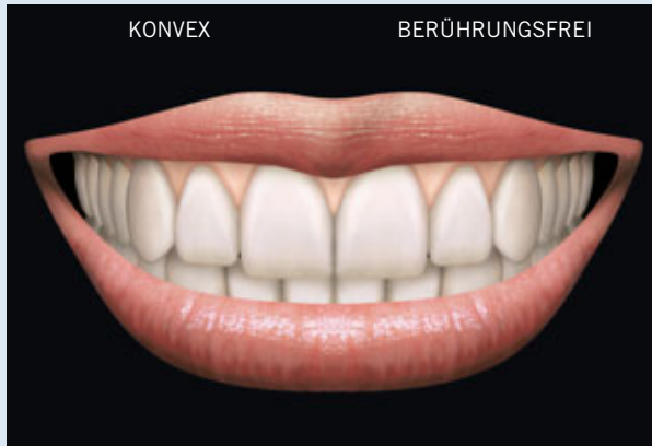
> Abb. 3-8a