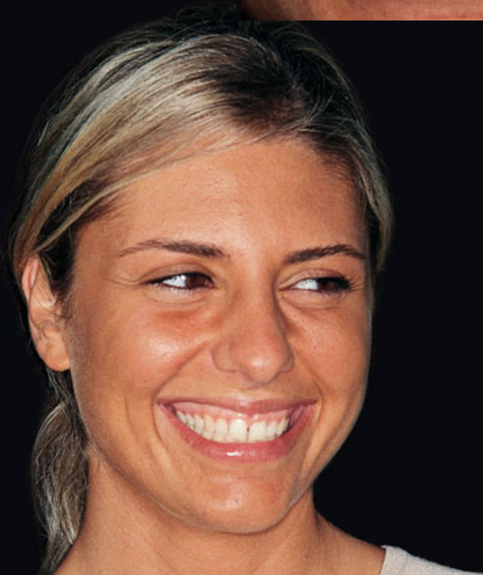
> Abb. 3-1d