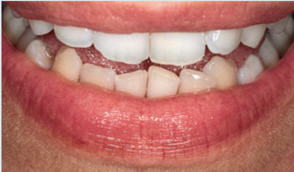
> Abb. 3-4a