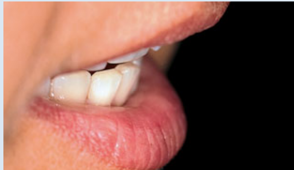
> Abb. 3-4d

Abb. 3 Die Lippenbewegungen können sich mit der Zeit verändern. Eventuelle Asymmetrien, die dabei zwischen der linken und rechten Lippenseite entstehen, machen sich insbesondere beim Lächeln bemerkbar (a und b).