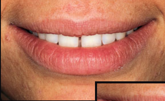
> Abb. 3-1a