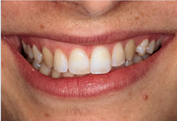
> Abb. 3-3a