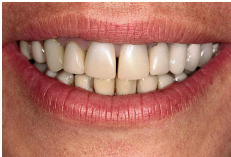
> Abb. 3-5c

Abb. 5 Das Diastema zwischen den oberen mittleren Schneidezähnen und die alten Kunststoffveneers oben und unten sind bei dieser Patientin in Ruheposition ebenso wie beim Sprechen besonders auffällig (a bis c). Die Kunststoffveneers wurden entfernt und mit ästhetischeren Materialien ersetzt (Kronen oben und Keramikveneers unten). Spontanere Lippenbewegungen zeugen vom wiedergewonnenen Selbstvertrauen der Patientin (d bis h).