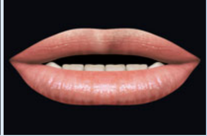
> Abb 3-6c