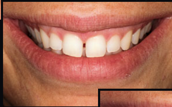
> Abb. 3-1b