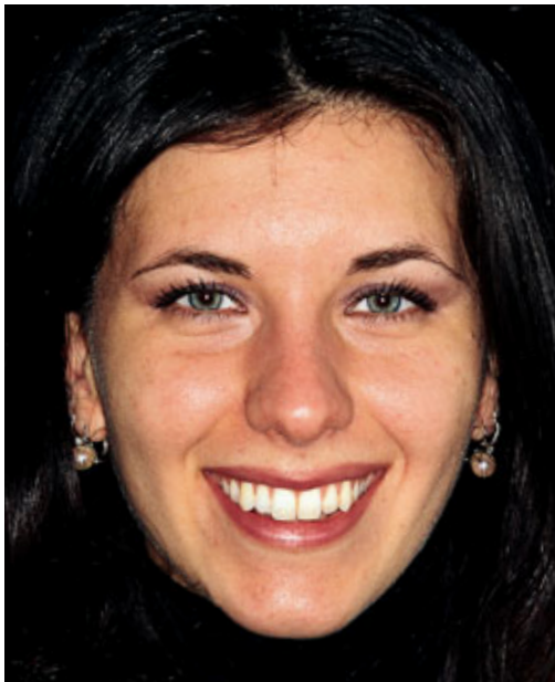
> Abb. 3-2

Durch einen veränderten Muskeltonus wird die Qualität dieser Bewegungen beeinträchtigt (Abb. 3-3 a und b). Nicht wenige Patienten haben infolge von neurologischen Störungen abfallende Lippen (Ptose). Auch psychische