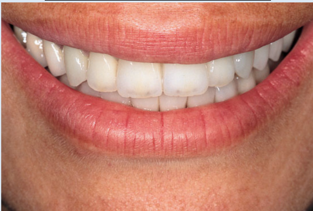
> Abb. 3-5h