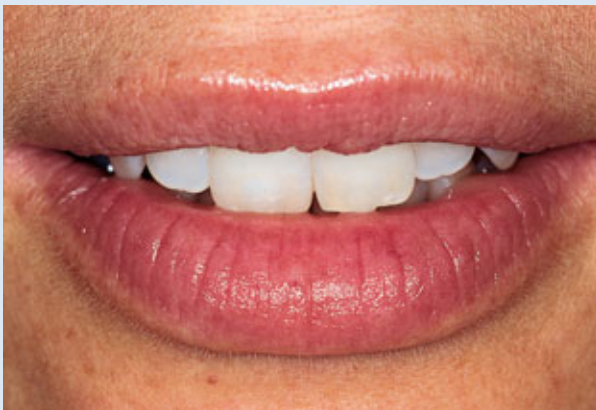
> Abb. 3-6d