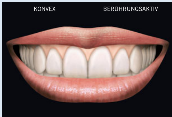
> Abb. 3-9a