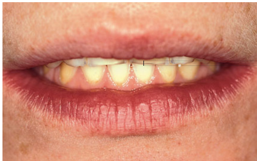
> Abb. 3-7c

Abb. 7 Erheblich verkürzte Kronen durch Abrieb und Erosion (a und b). Durch die eingeschränkte Sichtbarkeit der oberen Zahnreihe bei ruhendem Unterkiefer wirkt die Mundpartie vorzeitig gealtert, was diesem jungen Gesicht (30 Jahre) eine besonders unästhetische Note verleiht (c). Nach der prothetischen Sanierung des Frontzahnbereichs haben die oberen Schneidezähne wieder ihre normale Länge (d bis i)