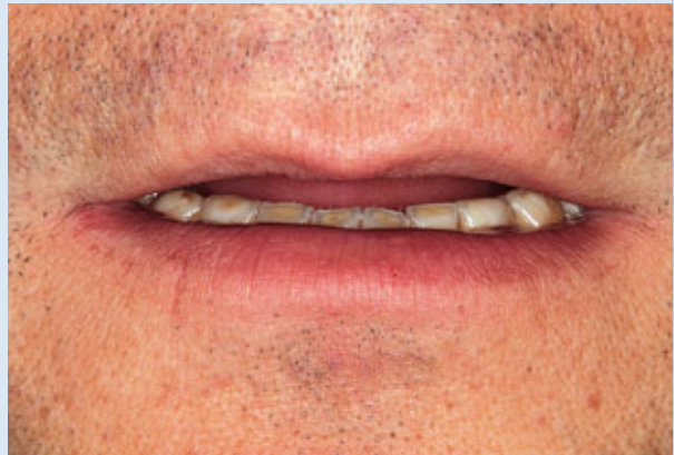
> Abb. 3-6g