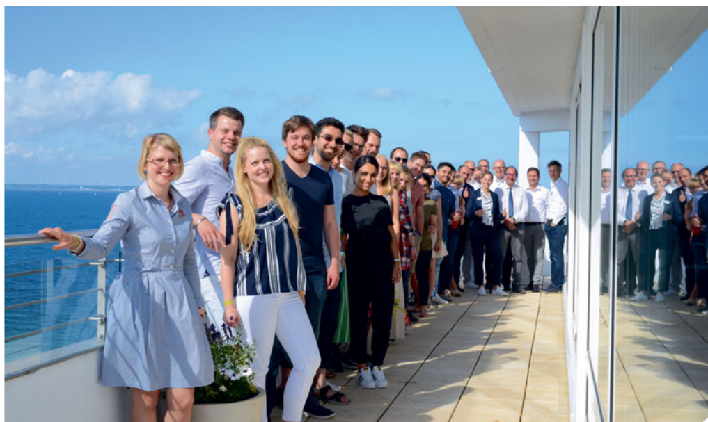
„My First Implant“ stieß auch in diesem Jahr auf reges Interesse.

Schwerpunktthema seitens der DGÄZ war die Augmentation, die bei entsprechenden Voraussetzungen sowohl ästhe-