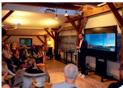
Der Private Roof Club bot eine tolle Atmosphäre – während des Vortrags und danach!