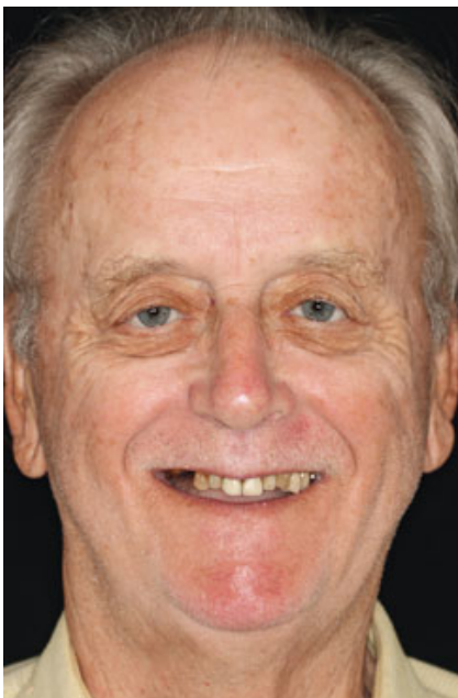
Abb.1 Porträtaufnahme Ausgangssituation.