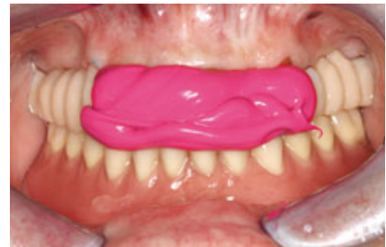
Abb. 9 Abformung und Kieferrelationsbestimmung.