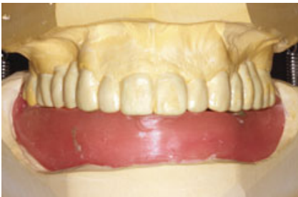
Abb. 4 (oben) Wax-Up der geplanten Rekonstruktion im OK.

Anschließend wurden im Unterkiefer die osseointegrierten Implantate freigelegt. Nach erfolgter Abformung und Kieferrelationsbestimmung ergab die Platzanalyse für das Gerüst der Hybridprothese eine linguale metallische Verstärkung („Backing“) beim Implantat 33 (Abb. 11). Die Hybridprothese