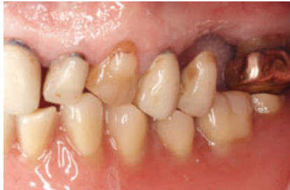
Abb. 3 Intraorale Ausgangssituation.

Sitzung wurde der Oberkiefer effizient in die neu definierte Situation überführt, der Zahn 22 wurde extrahiert und das Schalenprovisorium unterfüttert (Abb. 6). Parallel dazu bereitete der Zahntechniker eine neue Unterkiefer-Interimsprothese vor, passend zur neuen Oberkieferdentition (Abb. 7).