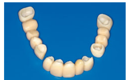
Abb. 6 Präparation und provisorische Versorgung im Oberkiefer.