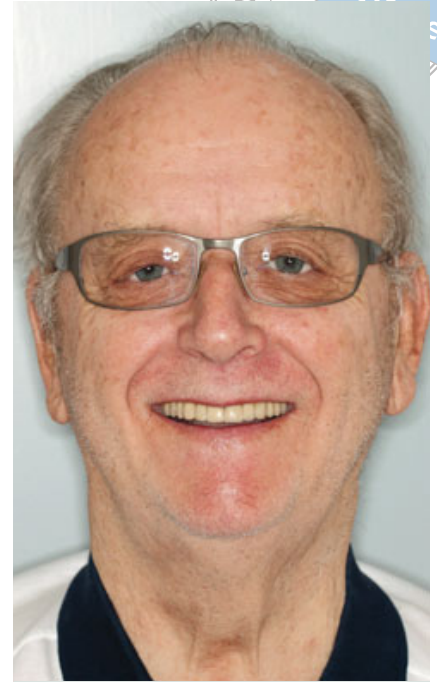
Abb. 13 Porträtaufnahme Abschluss.

wurde dementsprechend fertiggestellt und die Locatormatrizen intraoral einpolymerisiert. Die bestehende provisorische Totalprothese wurde als Reserveprothese adaptiert und als Ersatz dem Patienten mitgegeben (Abb. 12 und 13).