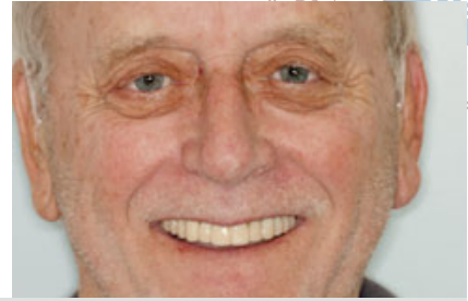
Abb. 7 Gesamtprovisorische Versorgung beider Kiefer.