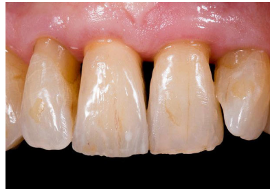
(Abb. 1: Stefanie Kretschmar)

Beim letzten Fotowettbewerb konnten Bilder aus allen Bereichen