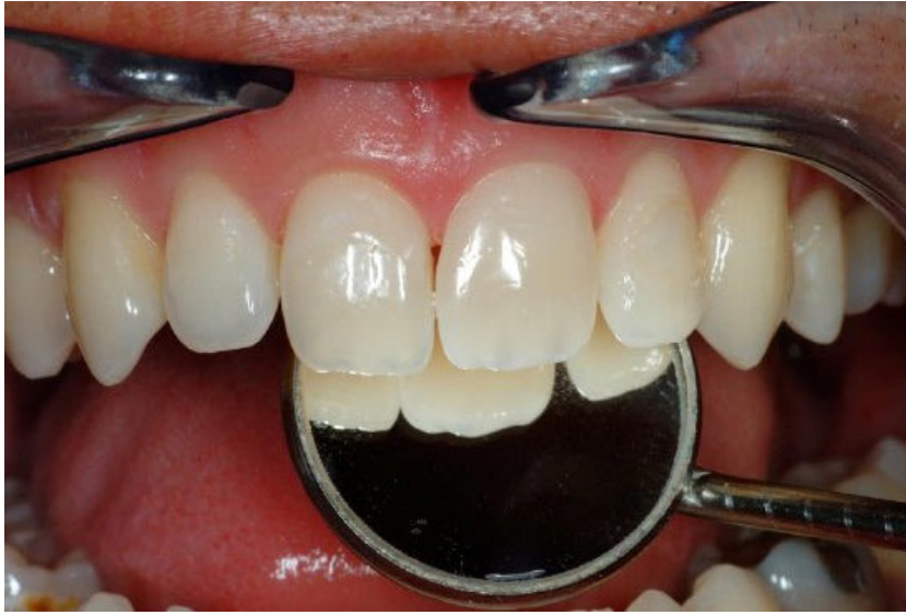
(Abb. 1: AG Keramik/Neumann)

Abbildung 1 Ästhetik und Funktion sind zunehmend im Fokus der Forschungsarbeiten. Jüngere Studien entschlüsselten die Zusammenhänge von Materialeigenschaften, Lichttransmission, Oberflächendesign, Invasivität und Vitalität sowie Zahnverschleiß.